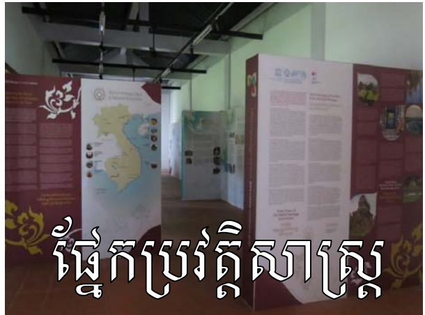
ផ្នែកប្រវត្តិសាស្ត្រ