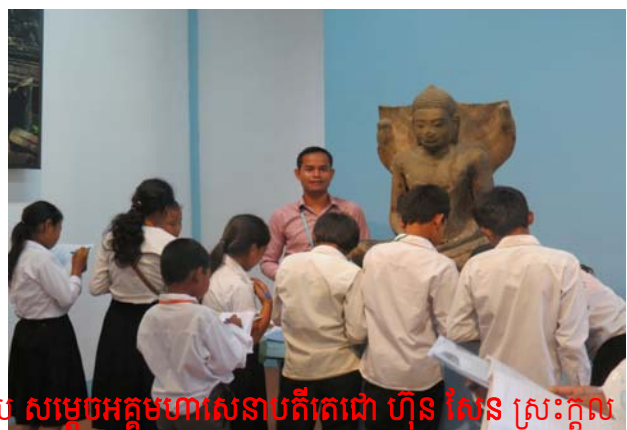
សិស្សានុសិស្ស មកពីសាលាបឋមសិក្សានិងអនុវិទ្យាល័យ សម្តេចអគ្គមហាសេនាបតីតេជោ ហ៊ុន សែន ស្រះក្តុល