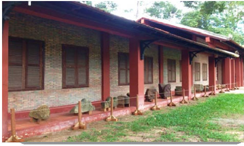
ទិដ្ឋភាពខាងក្រៅអគារ

អគារនេះ ប្រើប្រាស់ជាឃ្នាំង និងជាកន្លែងជួសជុលបុរាណវត្ថុ មុនយកទៅដាក់តាំង។