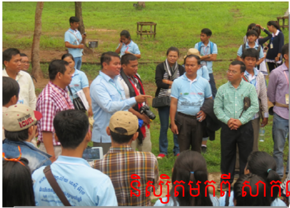
ទិស្សិតមកពី សាកលវិទ្យាល័យសុខស៊ី អ៊ីរ៉ុប