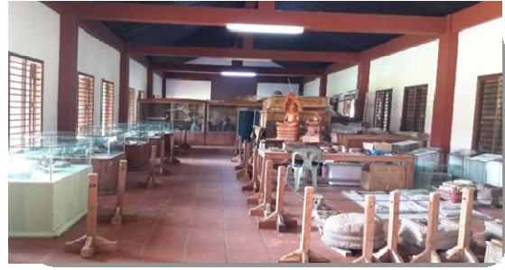
ទិដ្ឋភាពខាងក្នុងអគារ