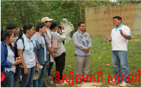
ទិស្សិតមកពី សាកលវិទ្យាល័យកូមិនូបិក្រសិល្បៈ