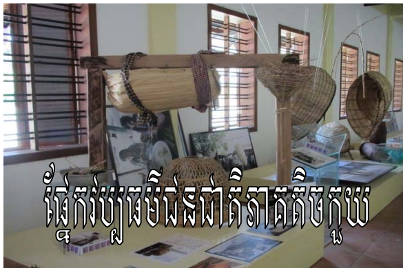
ផ្នែកវប្បធម៌ជនជាតិភាគតិចកួយ