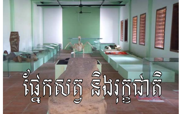
ផ្នែកសត្វ និងរុក្ខជាតិ