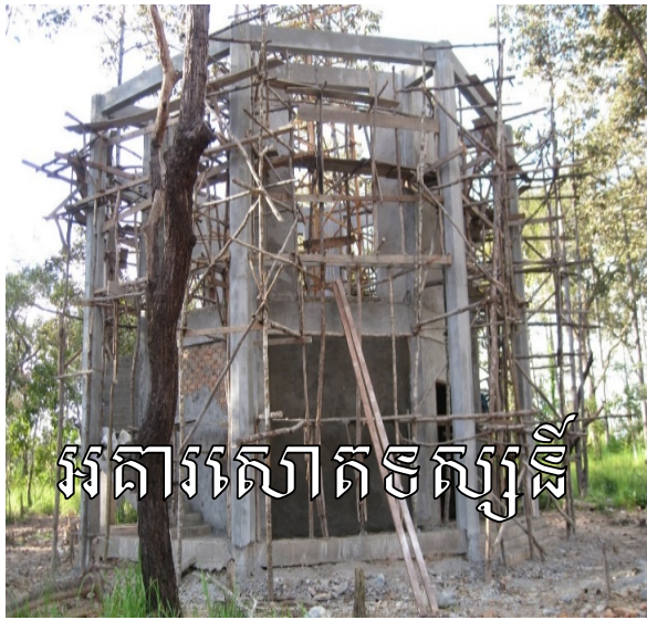
អគារស្រាត ទស្សនី