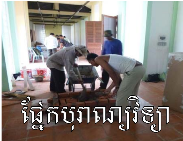
ផ្នែកបុរាណវិទ្យា

ក្រោយពីកិច្ចការសាងសង់បានបញ្ចប់ ក្រុមការងារតាំងពិព័រណ៍របស់សារមន្ទីរបានចាប់ផ្តើមរៀបចំដោយមានការចូលរួមពីអ្នកជំនាញការបរទេសផង បានសម្រេចបែងចែកការតាំងពិព័រណ៍ជា៥ផ្នែកគឺ (១)ផ្នែកបុរាណវិទ្យា (២) ផ្នែកប្រវត្តិសាស្ត្រ (៣)ផ្នែកវប្បធម៌ជនជាតិភាគតិចកួយ (៤)ផ្នែកសត្វ និងរុក្ខជាតិ និង(៥)ផ្នែករូបថតសិល្បៈ។