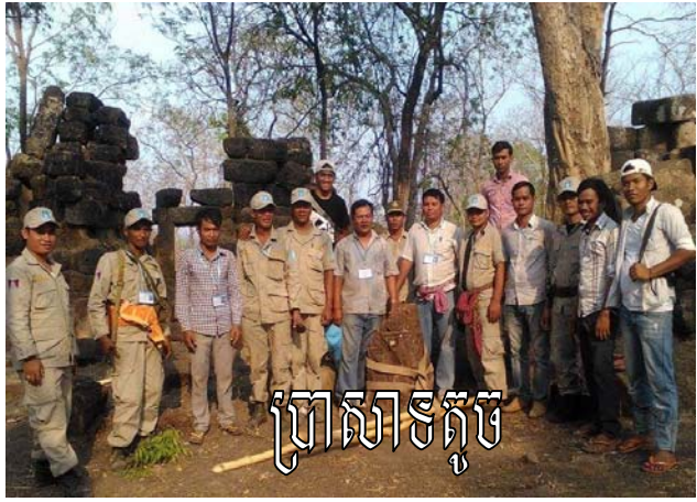
ប្រាសាទតូច