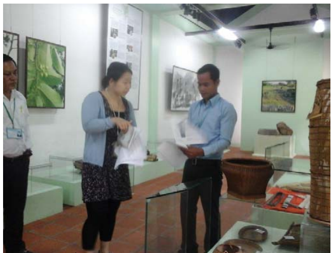
ក្រុមការងារ ក្នុងសកម្មភាពផ្ទៀងផ្ទាត់បញ្ជីសារពើភណ្ឌ