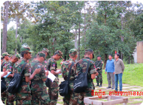
ទិស្សិត នាយទាហានសកម្ម