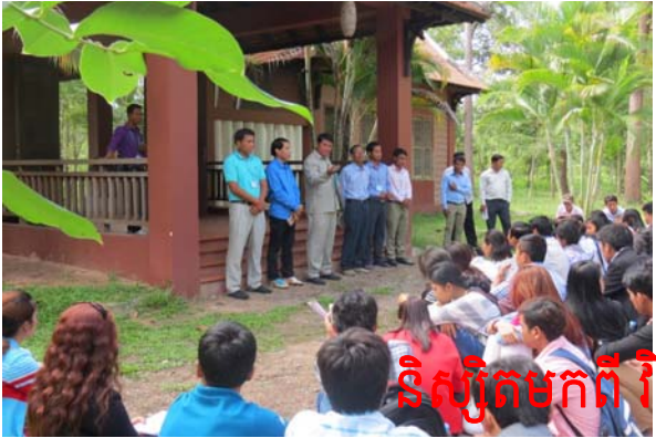
ទិស្សិតមកពី វិទ្យាស្ថានជំនាន់ថ្មី