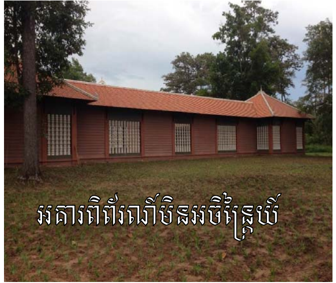
អគារពិព័រណ៍មិនអចិន្ត្រៃយ៍