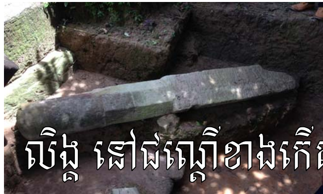
លិង្គ នៅជណ្តើរខាងកើតនៃប្រាសាទ ព្រះវិហារ